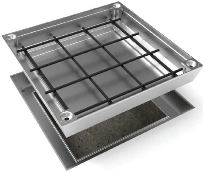
Kit de instalación y apertura